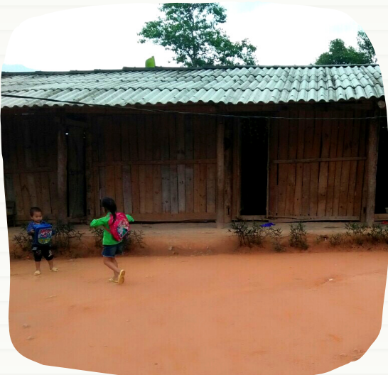
La scuola da rinnovare di Dong Chu

Scuole Sicure, progetto nato grazie al sostegno dell'Otto per Mille alla Chiesa Valdese e della Regione Autonoma Trentino-Alto Adige/Südtirol, mira a ricostruire due asili nel comune di Ngan Chien, nella Provincia di Ha Giang, in Vietnam . Oltre alle infrastrutture, si avvieranno corsi di formazione degli insegnanti di tutte le scuole del comune sulle corrette pratiche igieniche e saranno avviate campagne di sensibilizzazione su questo tema. Come in tutti i suoi progetti, GTV segue un approccio di partnership, coprogettazione e collaborazione con le autorità, gli enti e la popolazione: una "cooperazione di comunità" che si esercita anno dopo anno con dialoghi costanti e una presenza stabile nel territorio. È così facendo che il progetto Scuole Sicure vede la partnership con il Comitato Popolare del Distretto di Xin Man, l'autorità governativa locale. Inoltre grazie all'attivazione di un gruppo di aziende vietnamite, la prima delle due scuole target del progetto, situata nel villaggio di Coc Chiu , è stata già completamente ricostruita. Questa struttura è ora in muratura, sicura, spaziosa e salubre per i 28 bambini che la frequentano giornalmente, completa di bagni con acqua corrente a disposizione.