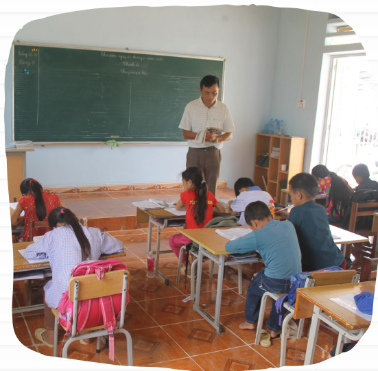
La scuola ricostruita di Na Hu