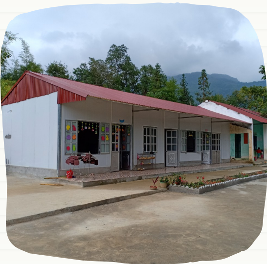
La scuola rinnovata di Coc Chiu